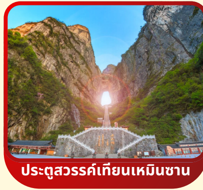
ประตูลั่วสวี่เทียนเหมินซาน