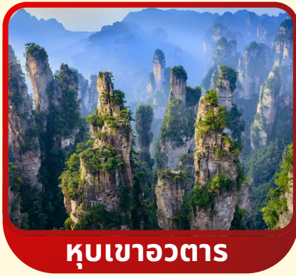
หุบเขาอวตาร