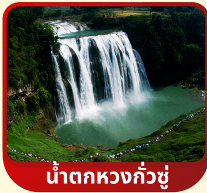
น้ำตกหวงกั๋วชู่