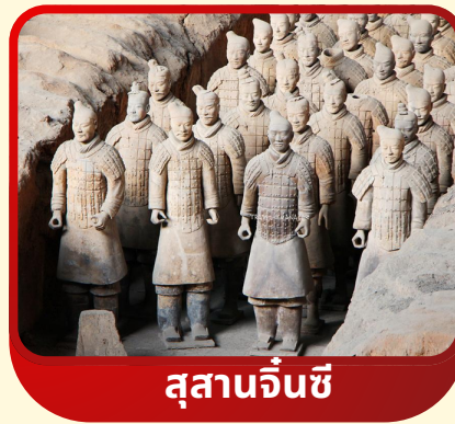
สุสานจีนซี