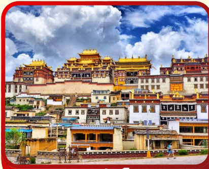
พระราชวังโปตาลา