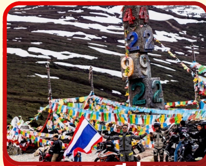
แซงกริล่า