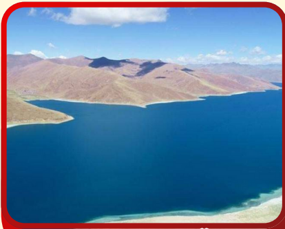
ทะเลสาบยิมตริ็อก