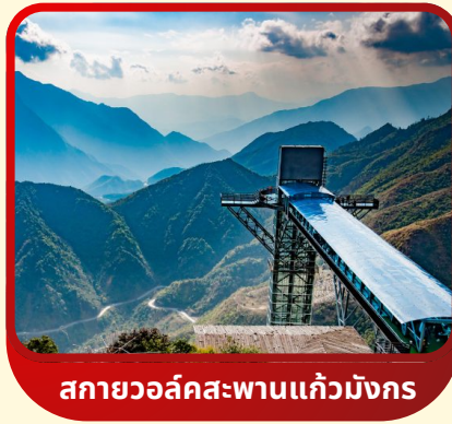
สกายวอล์คสะพานแก้วม้งกร