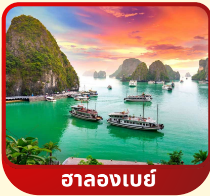
ฮาลองเบย์