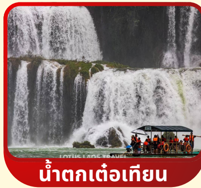
น้ำตกเต๋อเทียน