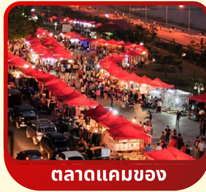
ตลาดแคมของ