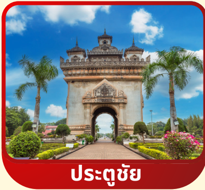
ประตูลุย