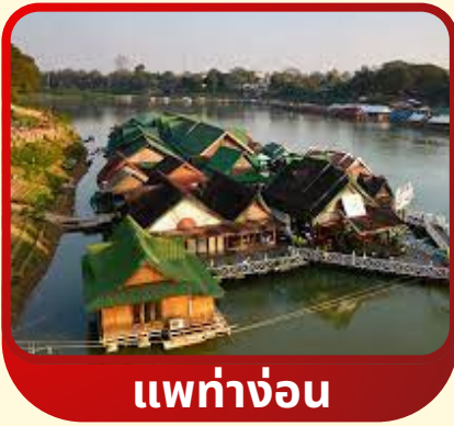
แพร่ท่าก่อน