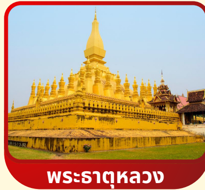
พระธาตุหลวง