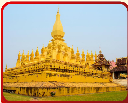
พระธาตุหลวง