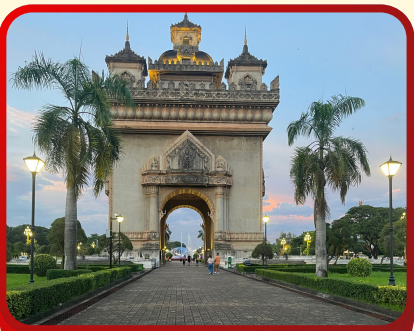
ประตูลิเบีย