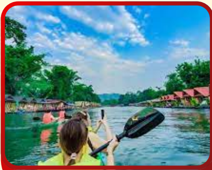
พายเรือคายัค