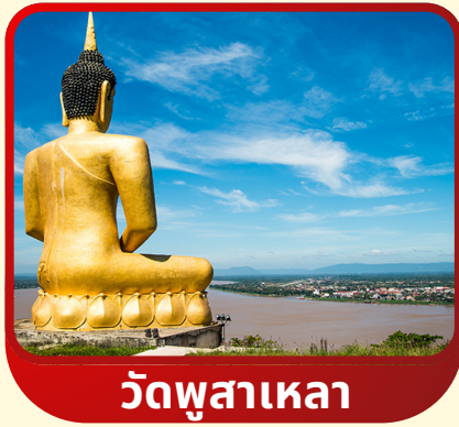
วัดพูสาเหลา