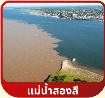
แม่น้ำสองสี