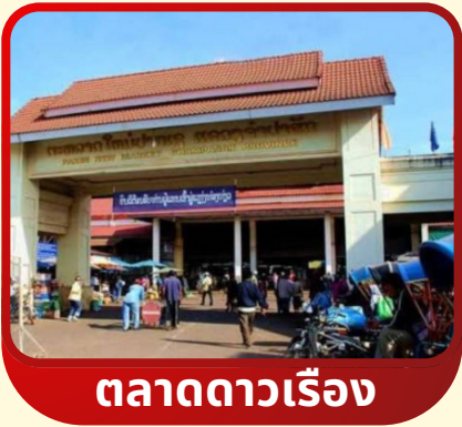
ตลาดดาวเรือง